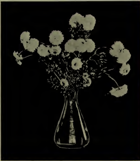
Chrysanthème—“Robe de mariée” (Bridal Robe).